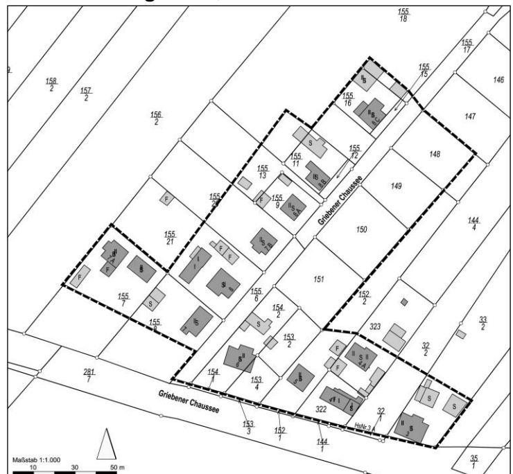
Abgrenzung Geltungsbereich Auszug aus der Liegenschaftskarte Gemeinde Löwenberger Land, Gemarkung Linde, Flur 1 und 2

Der Geltungsbereich der städtebaulichen Entwicklungssatzung „Griebener Chaussee Nord“ umfasst eine Fläche von insgesamt rund 1,8 ha, davon sind rund 1450 qm öffentliche Straßenverkehrsflächen.