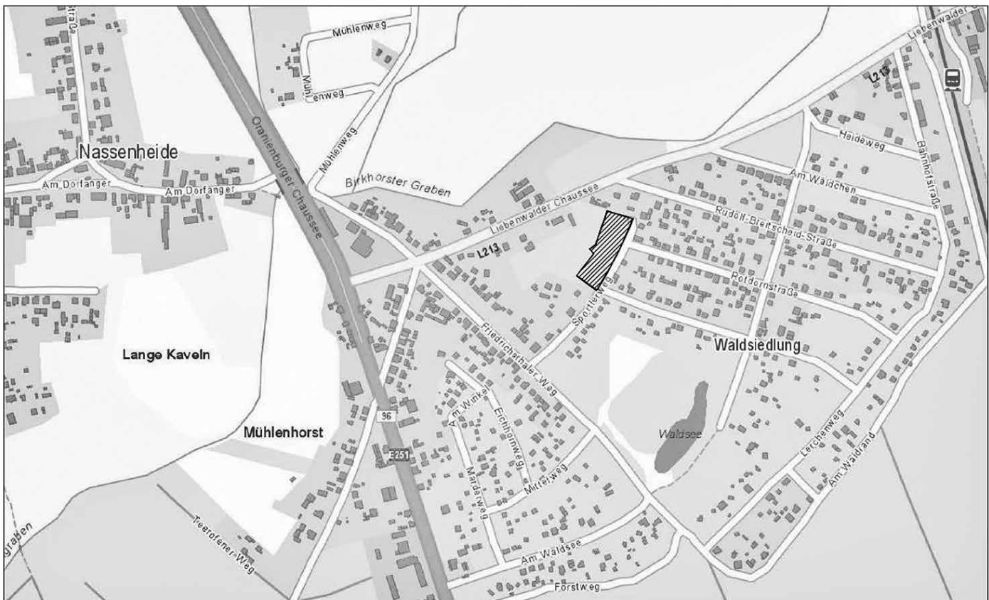
Übersichtskarte zum Bebauungsplan „Sportlerweg“ im Ortsteil Nassenheide der Gemeinde Löwenberger Land